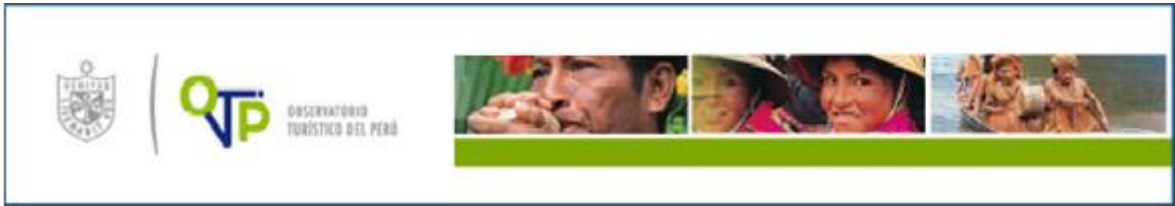
Perú: turismo interno histórico 1992-2019